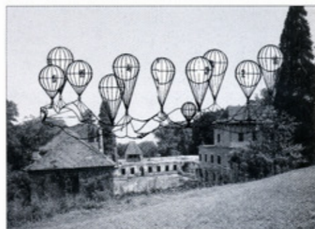
DVORAC OPEKA – KONCEPT STARO/NOVO

Za funkcionalističko i konstruktivističko gledanje obnavljati stare forme novim sredstvima jednako je ugrađivanju najnovijeg automobilskeg motora u model iz 1920-ih. Umjesto stvarnosti „arhitekture” dobiva se iluzija „scenografije”. Suvremeni, čvršći i kvalitetniji materijali i konstrukcije, mogu se u nekim manjim zahvatima lažirati i skri-