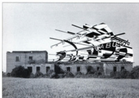
DVORAC ČABUNA – KONCEPT RASTA I PROMJENE

se ta zaštita realizirati, od kuda će se priskrbiti sredstva za tu zaštitu, znači ne rješavati problem. Pravna zaštita bi trebala olakšavati, a ne otežavati građevnu zaštitu. 7