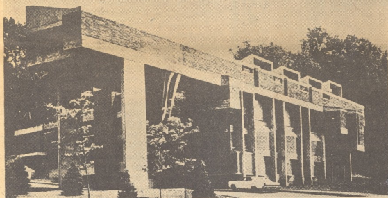
Paul Rudolph: život posvećen arhitekturi (na slici: jedan od njegovih objekata)

istaknuti parolu što je često rabe u nedostatku vlastite kreativnosti: „forma slijedi paru“. Rudolph međutim postiže jednako vrijedne rezultate i kada projektira u ograničenim datostima. Bez obzira na obilje stanova, petina Amerikanaca još stanuje u nepovoljnim uvjetima. Dobar dio Rudolphove aktivnosti je usmjeren na jeftino stanovanje. Projekt „Oriental Masonic Gardens“ izveden u New Havenu daje primjer stvaranja vrijedne psihološke okoline i u reduciranoj mogućnosti.